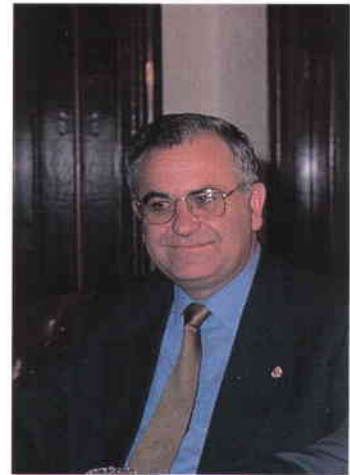
El espíritu de colaboración marcó la reunión entre representantes de la FEMP y del Ministerio del Interior. Arriba, el Director General de la Policía, Juan Antonio Cotino, miembro de la Comisión de Protección Ciudadana de la FEMP hasta su nombramiento.