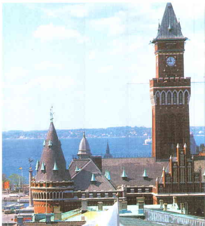
A la izquierda, la ciudad de Mölle; a la derecha, el Ayuntamiento neogótico de Helsingborg, al sur del país.

Los órganos ejecutivos territoriales son las Comisiones Ejecutivas Municipales y las Comisiones Ejecutivas de los Consejos de Condado, elegidas en los dos casos por los Consejos y Asambleas de entre sus miembros. La función de los Consejos es la de gestión y coordinación, aunque tienen capacidad para dar su opinión y orientaciones generales en ciertos asuntos económicos de interés y para presentar a los Consejos o a otros órganos las propuestas que consideren útiles.