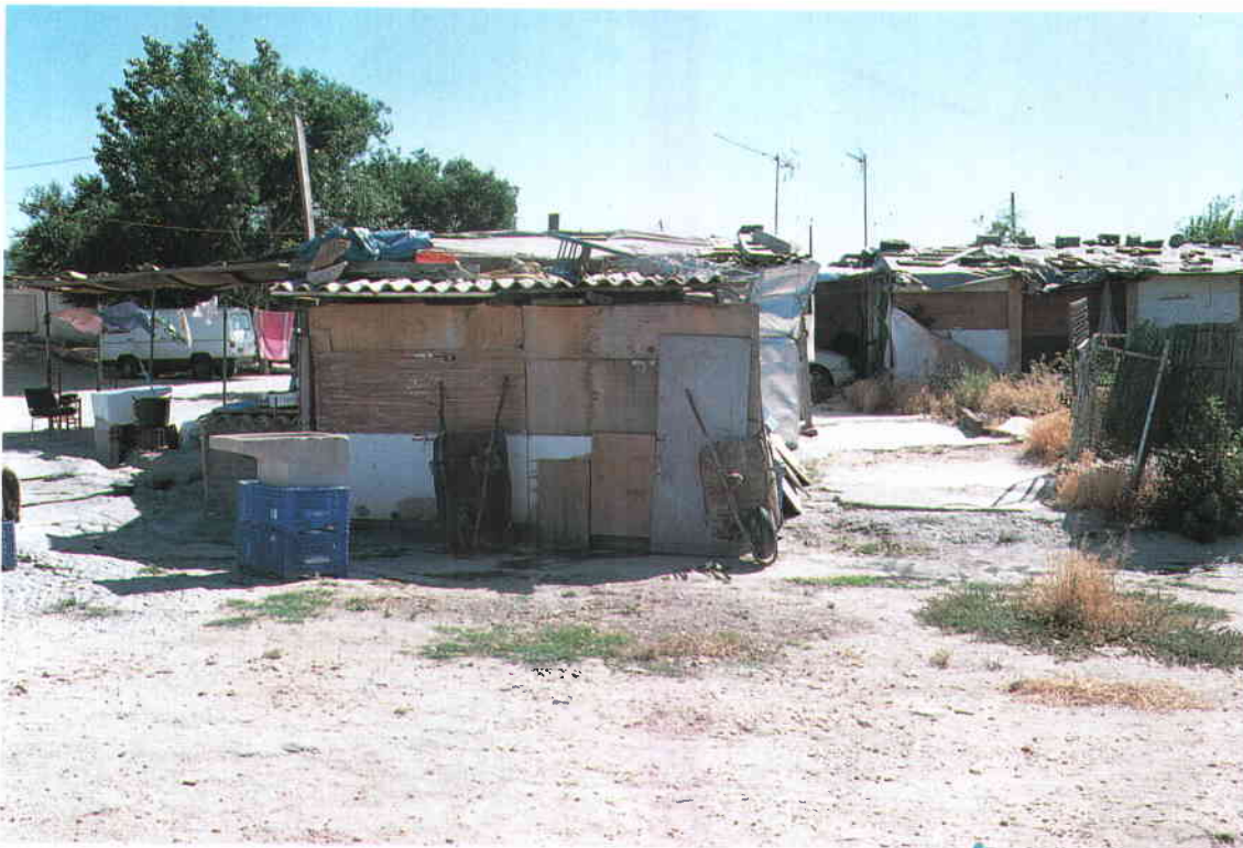
El desarrollo anárquico de las ciudades genera grandes bolsas de infravivienda en el mundo.

Más de 500 Alcaldes de todo el mundo reclamaron en Estambul el reconocimiento de su papel como principales responsables en la construcción de ciudades habitables, durante la celebración de la Asamblea Mundial de Ciudades y Autoridades Locales, que tuvo lugar en Estambul durante los días 30 y 31 del pasado mes de mayo, con carácter de encuentro previo a la realización de la Cumbre Habitat II, organizada por las Naciones Unidas, y que contó con la participación de varios responsables locales españoles. Habitat II ha sido la primera cumbre de la ONU en la que los Alcaldes han podido hacer oír su voz.