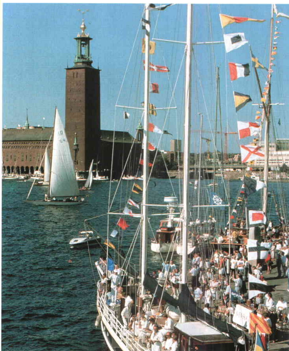
Los Ayuntamientos suecos tienen una amplia capacidad de gestión. En la imagen, el puerto de Estocolmo con la torre del Ayuntamiento al fondo.

Los 286 Ayuntamientos y los 23 Consejos de Condado constituyen los dos eslabones principales de la estructura territorial sueca; ambos cuentan con órganos de gobierno elegidos por sufragio universal cada tres años y gozan, sobre todo los municipios, de una amplia capacidad de gestión respaldada por la ley y por el principio de soberanía popular de este país. Existe además otra figura territorial, la parroquia, aunque no pasa de ser una subdivisión territorial de administración eclesiástica