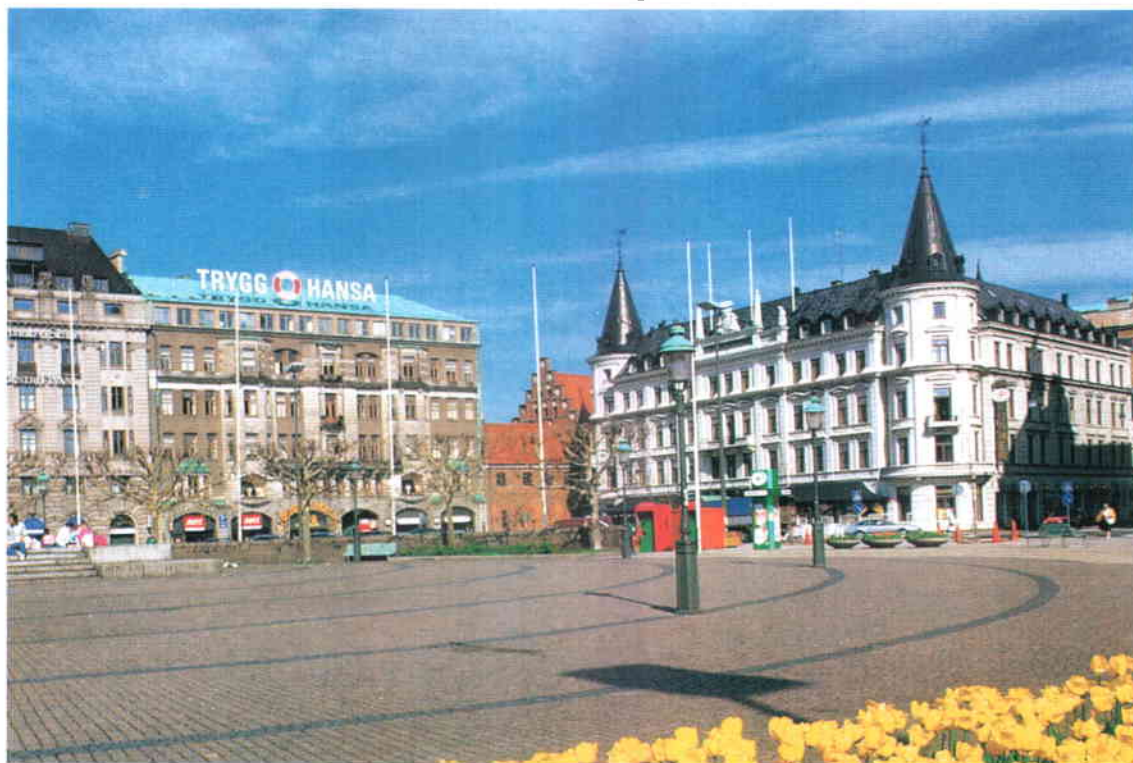
Las Entidades Territoriales suecas pueden asociarse para cooperar en cuestiones de interés común. A la izquierda, la Gran Plaza de Malmö, la segunda ciudad del país.

Las Entidades Territoriales suecas pueden asociarse para cooperar en cuestiones de interés común y constituir asociaciones de derecho público, según queda recogido en la normativa del país. Lo más habitual es que estas asociaciones cuenten con un Consejo Plenario, como máximo órgano de gobierno, y además, con una Comisión Ejecutiva o un Consejo de Dirección. Sea cual sea la forma jurídica que adopten, estas Asociaciones deben definir claramente en los estatutos sus objetivos, su ámbito de actividad y la duración de ésta. Las asociaciones más habituales suelen constituirse para organizar la lucha contra incendios, la atención social a personas mayores y la creación y gestión de centros escolares. ■