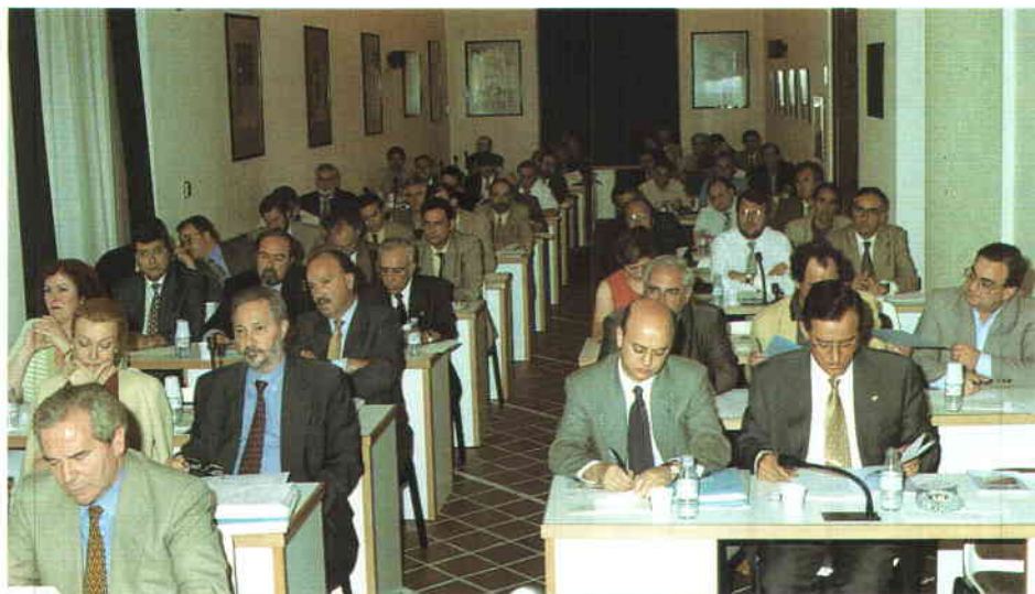
Los miembros del Consejo Federal realizarán aportaciones al documento sobre el Pacto Local.

El borrador incorpora todas las competencias que deberían ser transferidas a las Corporaciones Locales. Estas hacen referencia a las siguientes materias: Circulación y Transportes, Consumo, Deportes, Educación, Empleo, Juventud, Medio Ambiente, Mujer, Protección Ciudadana, Sanidad, Servicios Sociales y Urbanismo.